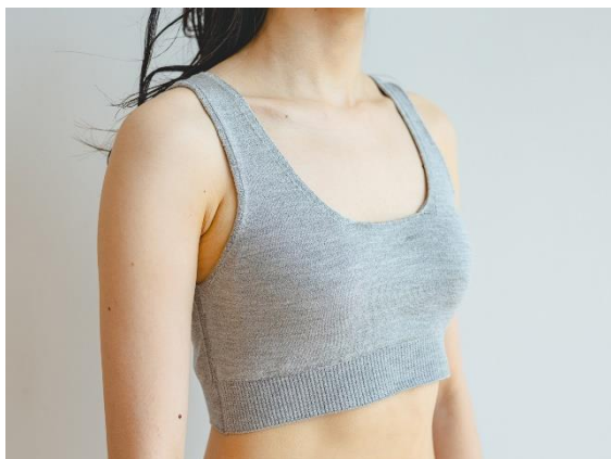
「シルクハーフトップ」

パッド部分の生地を二重にし、外側と同じようにシルク 84%の生地がお肌にあたります。カップはひとつづきのピーナッツパッドを使用することで、ずれにくく、バストの形を美しく保ちます。パッドを取り外せば、より開放感のあるナイトブラとしても活用可能。リブ部分は特殊弾性糸を入れ、体にぴたっと馴染みます。締め付け感はないまま、身体にやさしくフィットします。