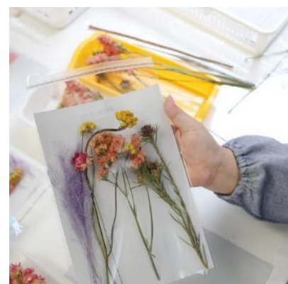
障がい者就労継続支援A型事業所「ピース事業所」、「メリーピース事業所」で働く方々の様子